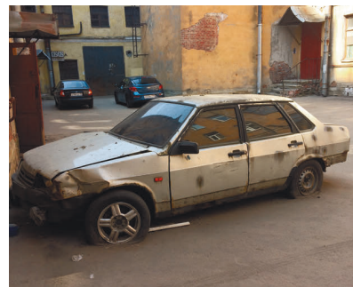
15-я линия, дом 82