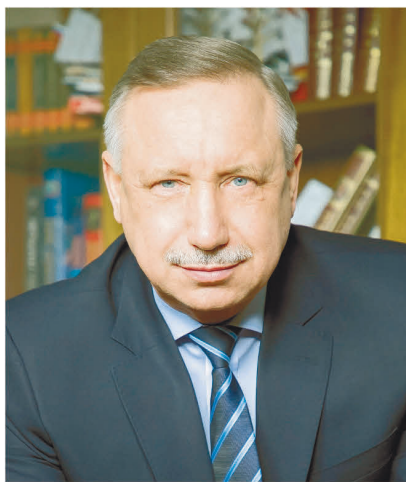
Временно исполняющий обязанности Губернатора Санкт-Петербурга А.Д. Беглов

Вместе мы приведем Петербург к новым успехам! С праздником! С Днем города!