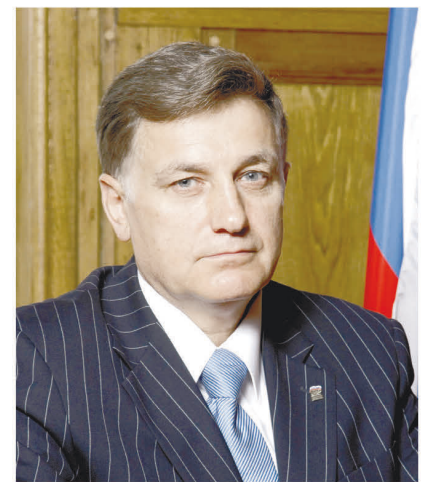
Председатель Законодательного Собрания Санкт-Петербурга В.С. Макаров