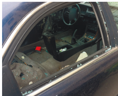
13-я линия, дом 44